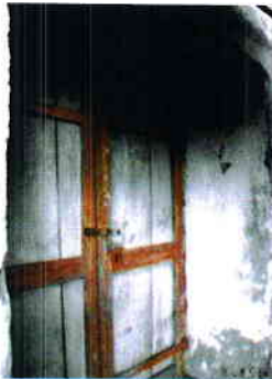
Prikazi sve fotografije