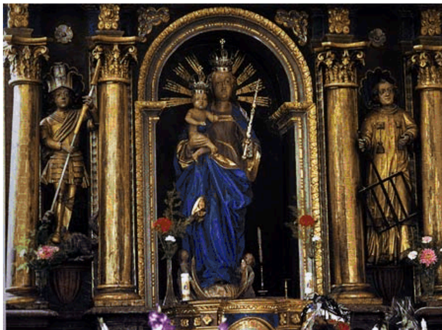
Kip Majke Božje Gorske privlači pozornost vjernika i poznavatelja kulturne baštine

Na jednom od brežuljaka ispod Ivančice u Hrvatskom zagorju, smjestilo se marijansko svetište Majke Božje Gorske, već stoljećima odredište mnogih hodočasnika. Iz mjesta Lobor, za pola sata hoda - strmi put s jedne i cesta s druge strane brijega vodi prema Majci Božjoj Gorskoj, okruženoj mnoštvom zelenila zagorskih šuma, a tik do nje - tek još pokoja kuća s pokojim ljubiteljem mira i prirode. Samo mjesto pravi je raj za odmor duše, tim više što je u njemu Marijino svetište u kojemu brojni hodočasnici tiho šapuću svoje potrebe, molitve i zavjete te nalaze utjehu i uslišanje u svojim potrebama.